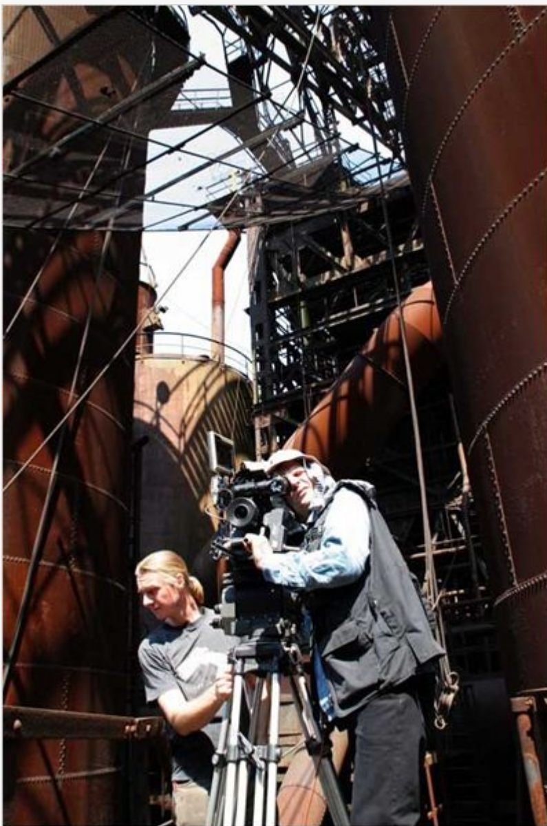
Lucas Belvaux : tournage de « La Raison du plus Faible »

L'impact visuel et graphique des Forges ne laisse pas les artistes indifférents. Là où la plupart des gens ne voient que ferailles, tôles, enchevêtrements de tubes et structures, les artistes transposent. Des milliers de photographies ont été prises aux Forges dont quelques clichés du couple d'allemands mondialement connu pour sa maîtrise de la photographie industrielle, Hilla et Bernd Becher .