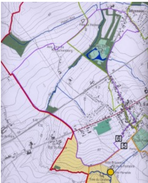
Plan de la promenade de Mussain