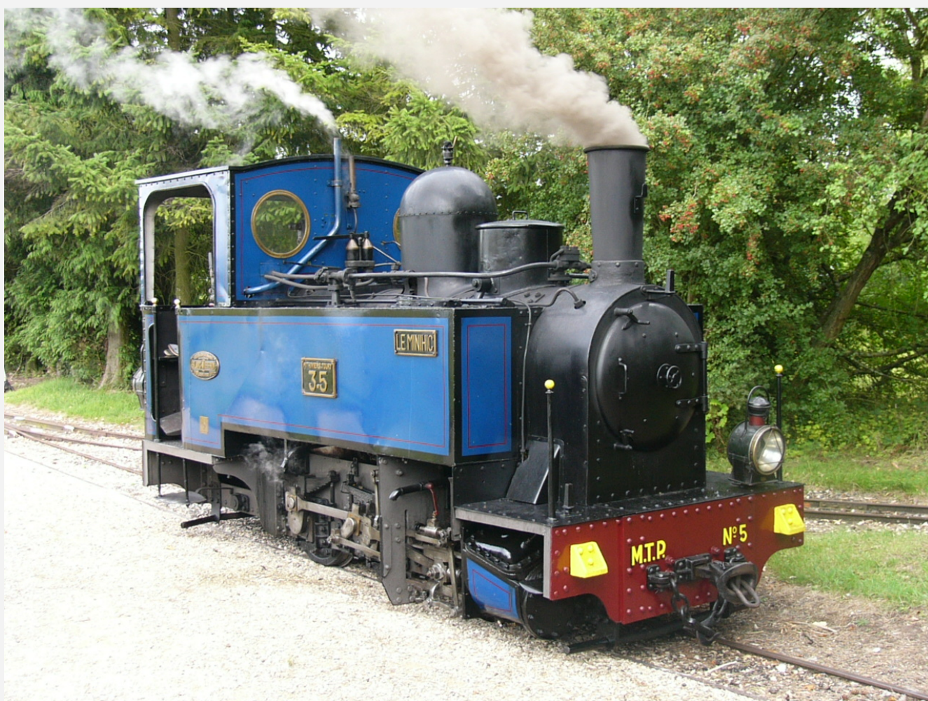
Tz 1317 - BM 282 - Tubize type 77 - TR 4 « Le Minihiac » - TPT 3-5 - Locomotive conservée par le MTP et toujours en service.