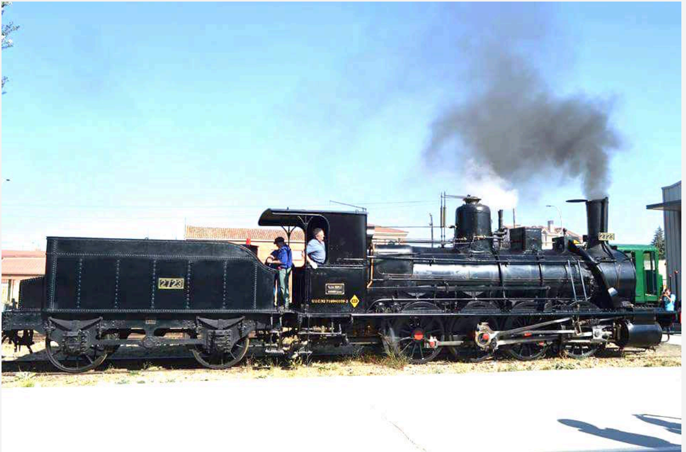
Tz 792 - Tubize type 43 - FC Almansa-Valencia-Tarragona 123 > FC Norte 2723 > RENFE 040-2184 > Asociacion de Amigos del FC, Venta de Baños, où elle est en service de nos jours.

EIGHT COUPLED : D (0-8-0) [Quatre essieux moteurs / tender séparé]