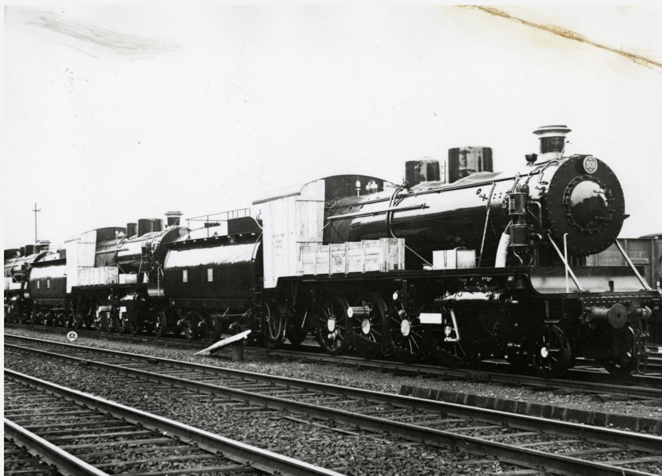
Tubize 2167 de 1934 pour le KiangNan (n° 301), au départ pour la Chine. Série 2167-2176, 1934, voie 1.435, 1Dh2 ou 2-8-0, KiangNan 301-310.