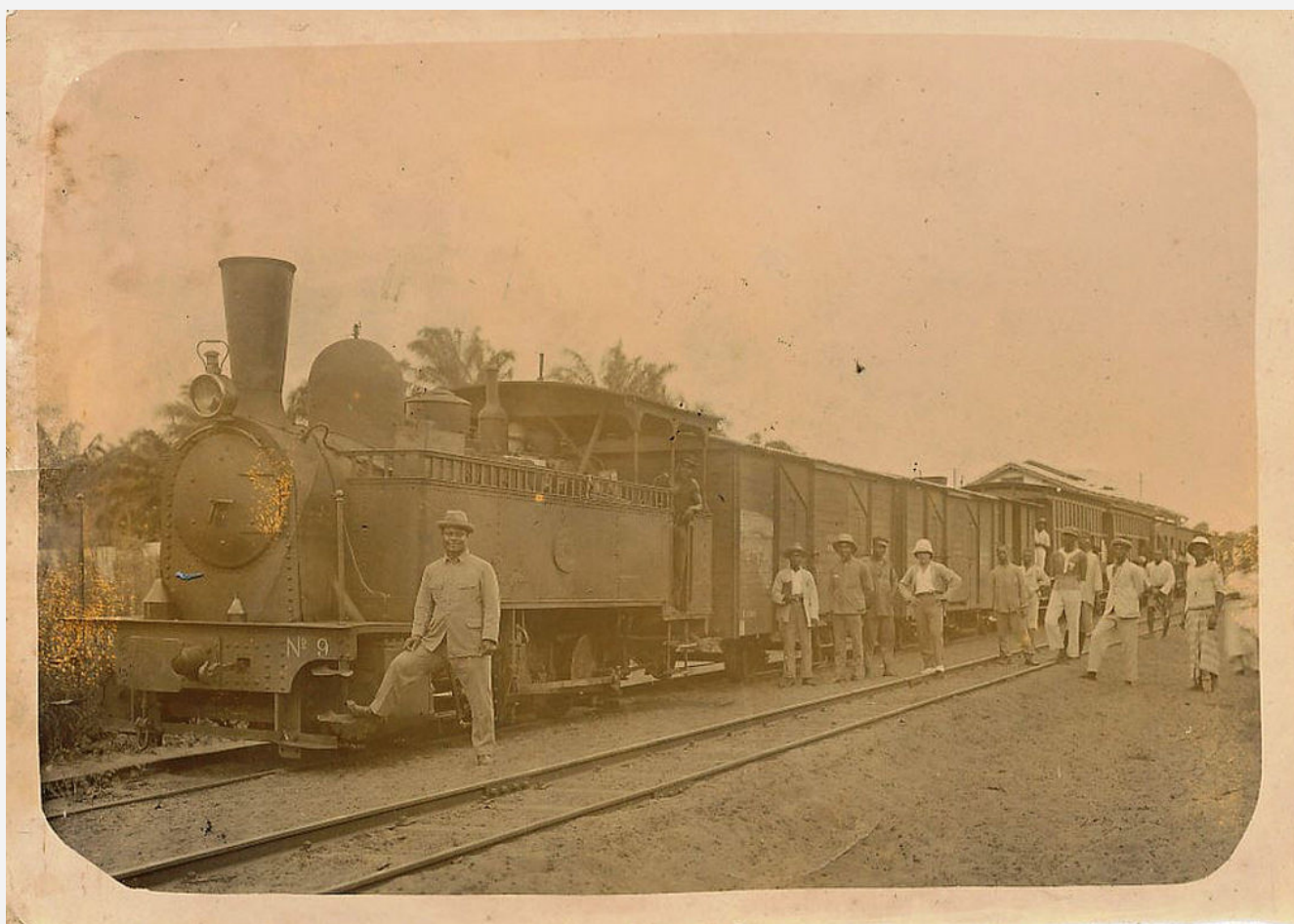
Tubize 1581 (BM 343) de 1908 pour la Compagnie française du Chemin de Fer du Dahomey (n°9).

Petit film éducatif de 1930 où l'on peut apercevoir les locomotives de la Compagnie française du Chemin de Fer du Dahomey.