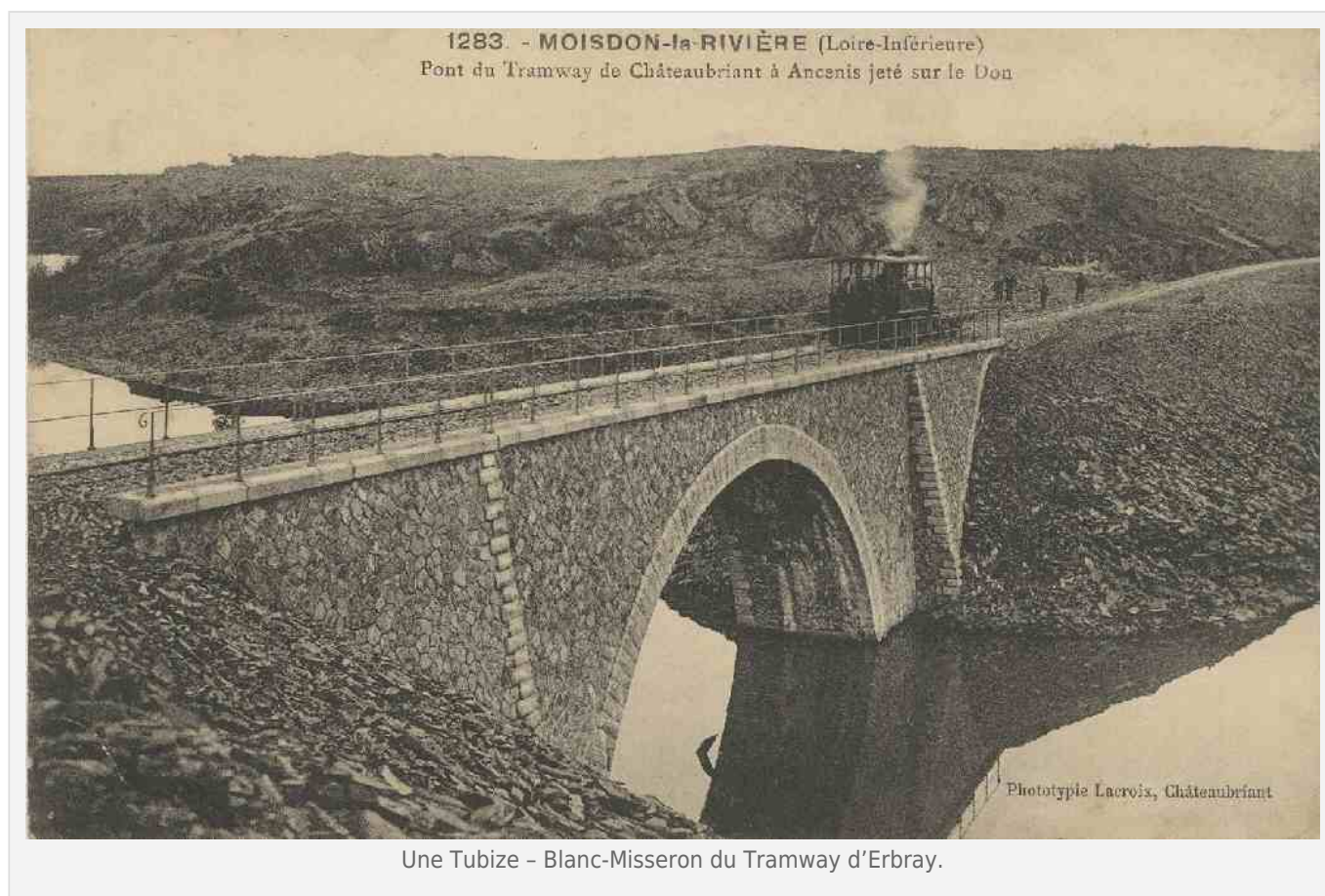
Une Tubize - Blanc-Misseron du Tramway d'Erbray.

Le Tramway d'Erbray était un réseau de chemin de fer secondaire à voie métrique située dans le département de la Loire-Atlantique exploité de 1886 à 1947 par une société fondée en 1887 sous la dénomination de Compagnie des Chemins de fer à voie étroite de Châteaubriant à Erbray et Extensions. Il se composait de deux lignes et s'étendait sur 78km.