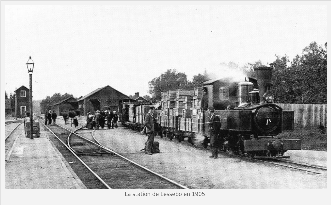
La station de Lessebo en 1905.