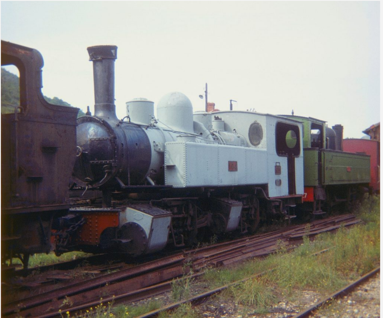
La Tubize 1476 (BM 340)