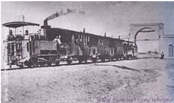
Loco Tubize en Iran