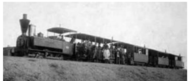
Loco Tubize en Iran