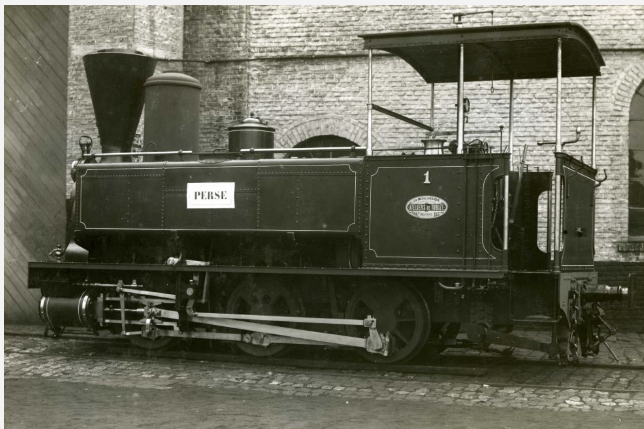
Tubize n° 662 de 1887 pour le CF et Tramways en Perse - Téhéran-Rey 1 - Photographie d'usine