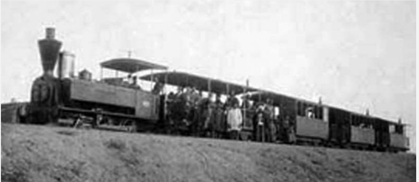
Une Tubize du CF et Tramways en Perse en service dans les environs de Téhéran

Les plus anciennes locomotives Tubize conservées se trouvent en Iran !