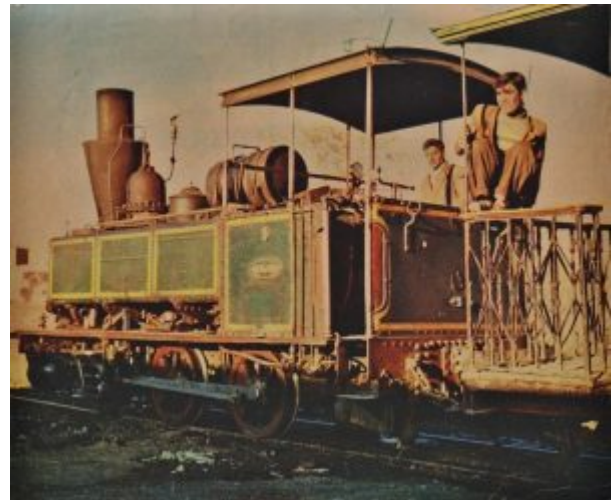
Tubize n°1436 de 1905