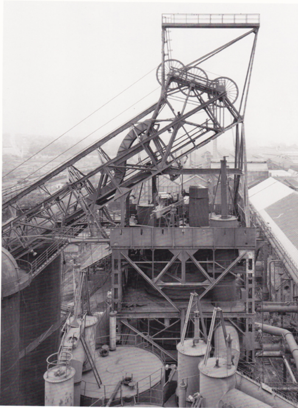
76. Clabecq/Bruxelles, B 1985

© Bernd and Hilla Becher Courtesy Sonnabend Gallery, New York Hochöfen Schirmer-Mosel