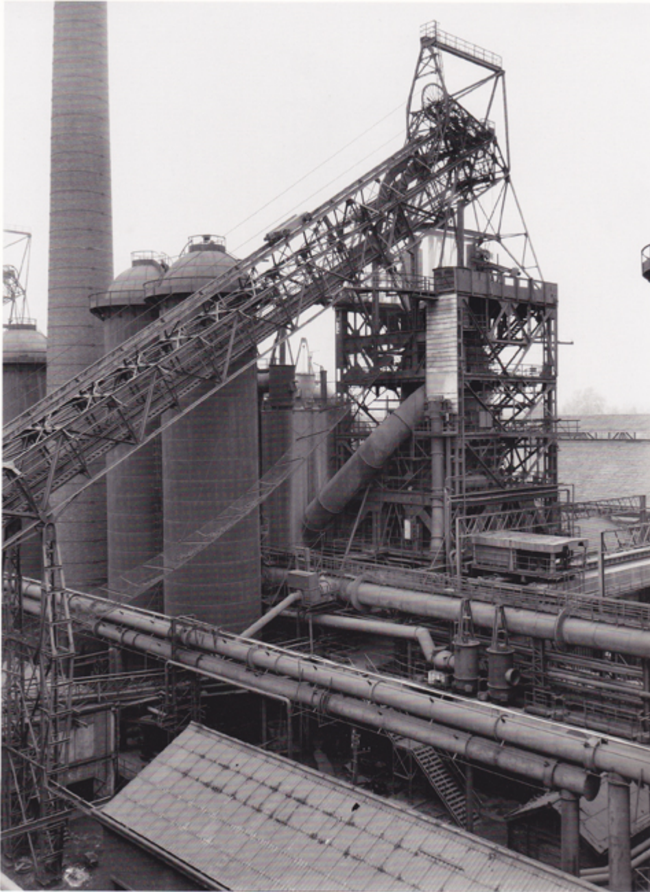
144. Clabecq/Bruxelles, B 1985

Hochöfen Schirmer-Mosel