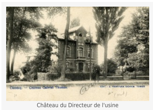
Château du Directeur de l'usine